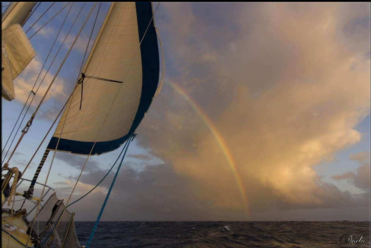
Au lendemain de la deuxième dépression jaillit des nuées un arc-en-ciel : la fin des tribulations ?